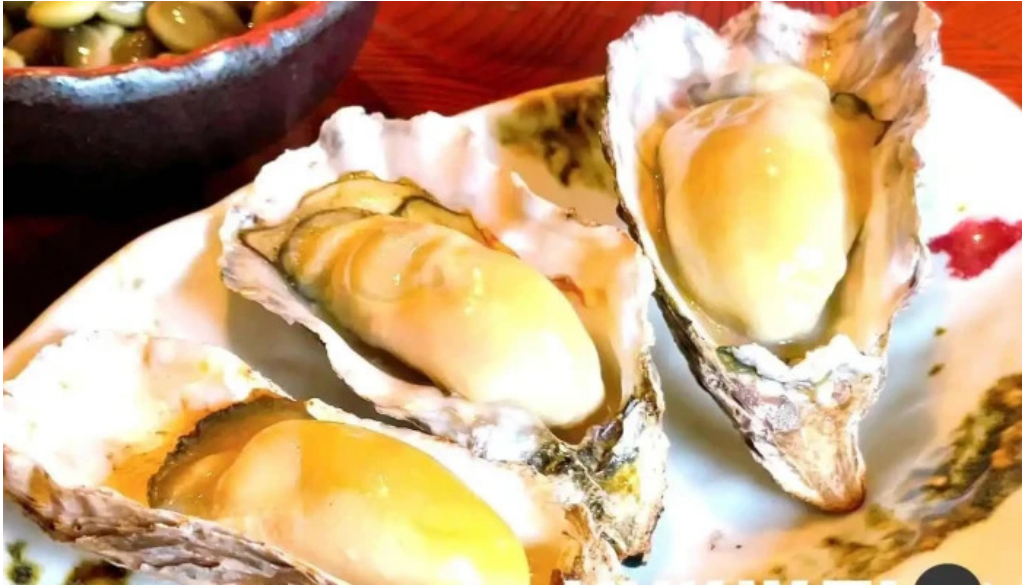
中目黒 牡蠣入し時 動画