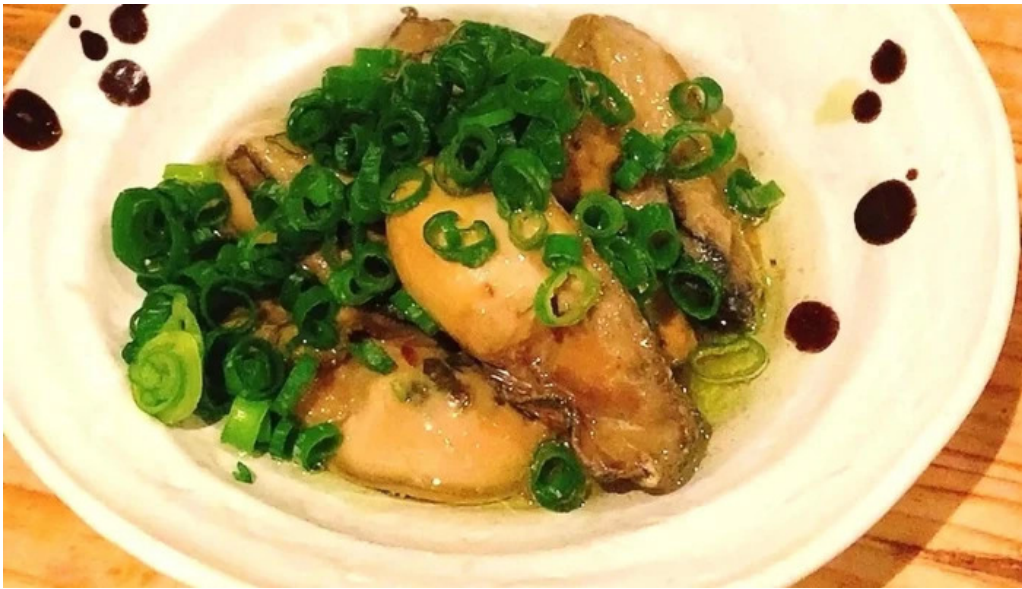
中目黒 牡蠣入レ時 電話