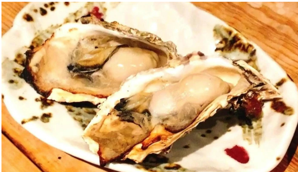
中目黒 牡蠣入レ時 カタログ