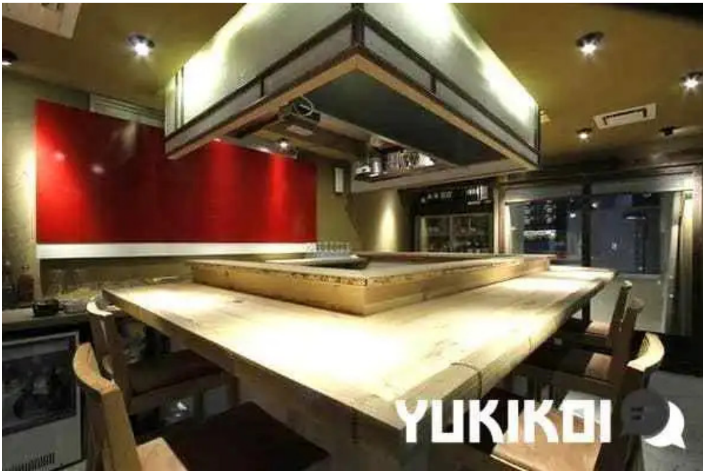
中目黒 牡蠣入レ時 雰囲気