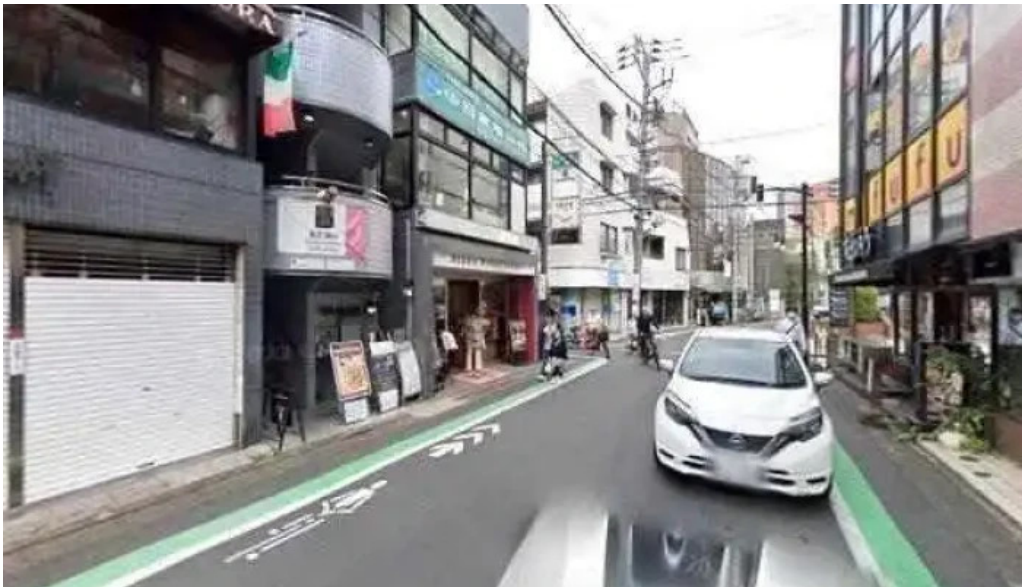
中目黒 牡蠣入レ時 目黒区