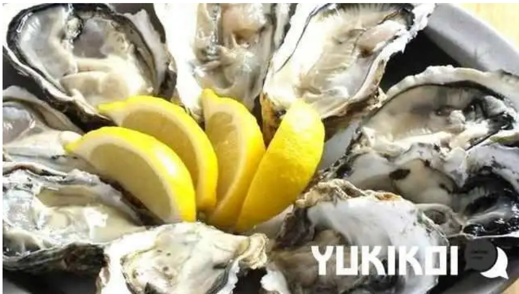
中目黒 牡蠣入レ時