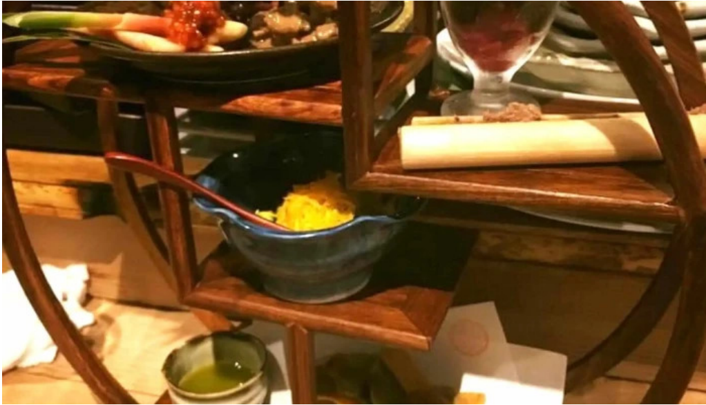
中目黒 牡蠣入レ時 番号