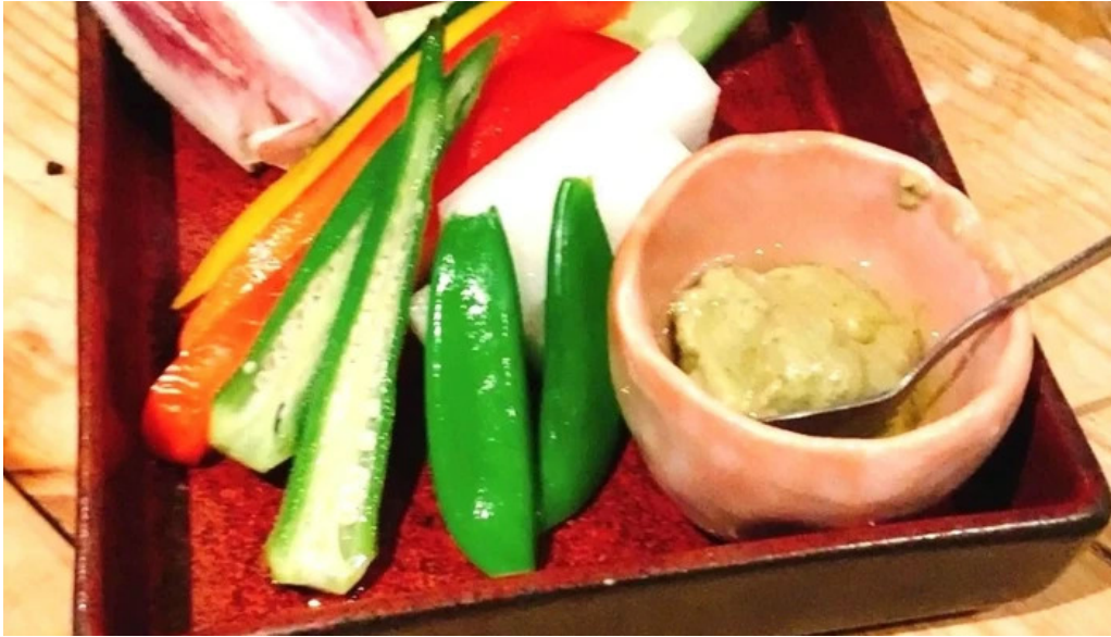
中目黒 牡蠣入し時 所在地