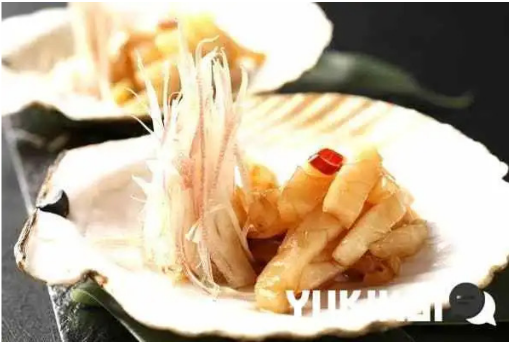
中目黒 牡蠣入レ時 料理飲み物