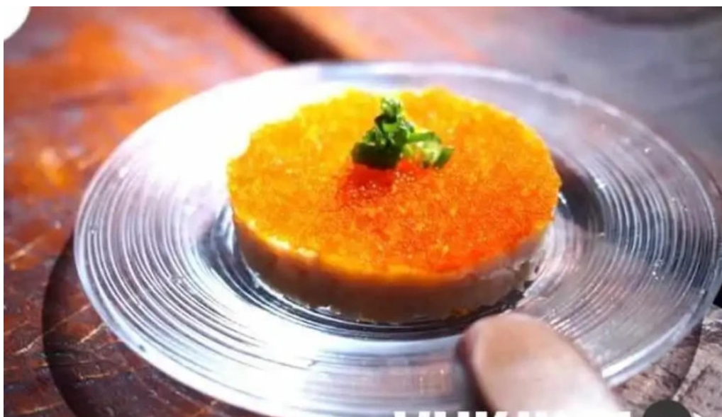
中目黒 牡蠣入レ時 魚卵