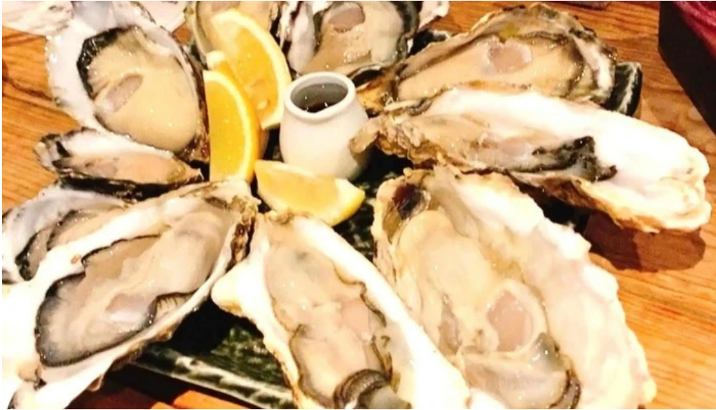
中目黒 牡蠣入レ時 行き方