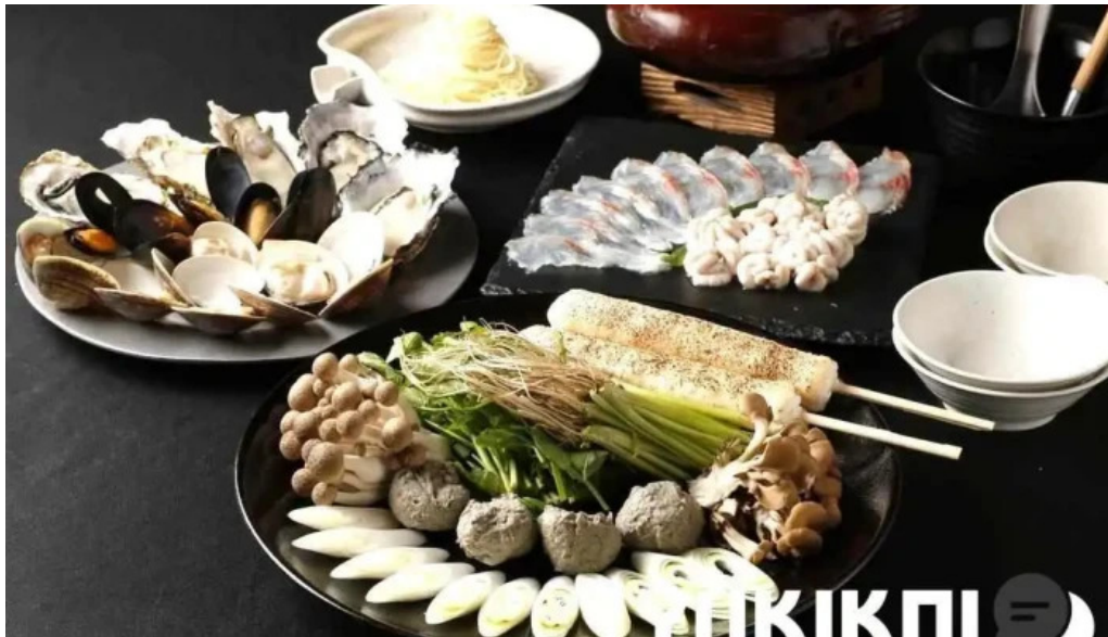
中目黒 牡蠣入レ時 カキ