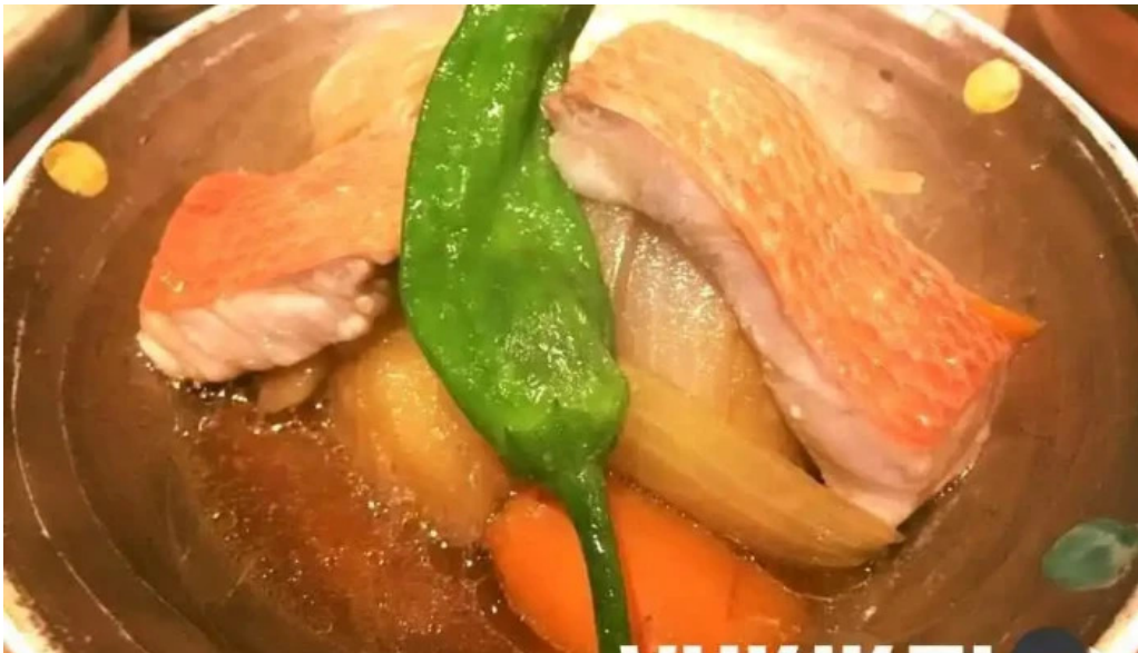
中目黒 牡蠣入し時 刺身